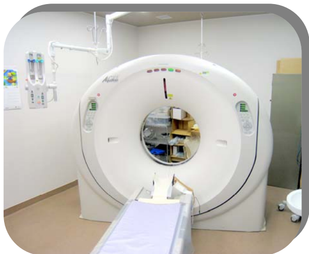
東芝マルチスライス CT

近隣のクリニックの先生方におかれましてはMRI・CT等の検査のご希望がありましたら当院へお問い合わせいただきご利用いただければ幸いです。