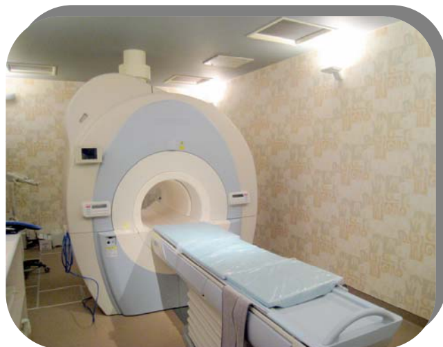
1.5 テスラ MRI 装置

この装置は、検査時の音への緊張と不安をできるだけ取り除き、安心して検査が受けられます。